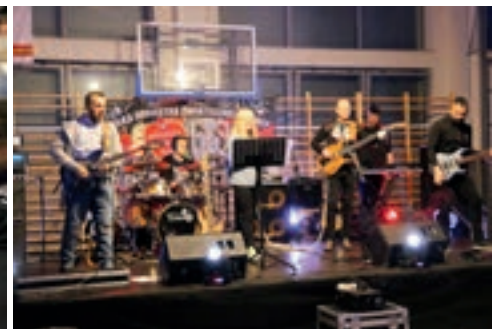
Koncert zespołu Gangsters Rock