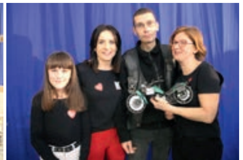
... modeli od klubu Iskra Nowe skalmierzyce,