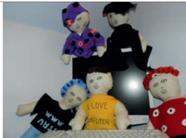
Kółko teatralne ma w swoim repertuarze m.in. przedstawienie o cyberprzemocy

W tym roku szkolnym uczniowie wraz z opiekunką przygotowali świąteczne przedstawienie teatru cieni. W ramach innowacji „Światło, płótno, ja – teatr cieni” przygotowali inscenizację bożonarodzeniową dla najbliższego środowiska, a w przerwie międzyświątecznej mieliśmy także okazję