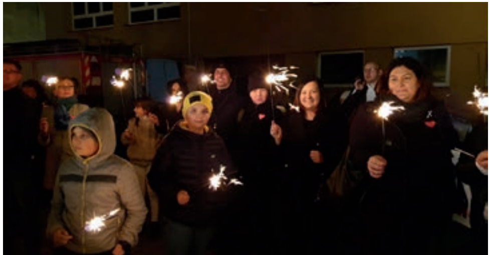
Światelko do nieba