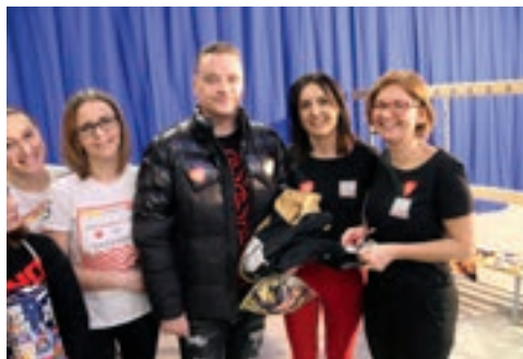
... kurtki z autografem Bartka Zmarzlika,