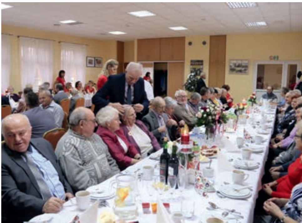
Najstarszym uczestnikom spotkania wręczono puchary i kwiaty