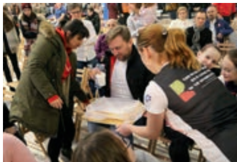
... i słodkich wypieków od Kół Gospodyń Wiejskich