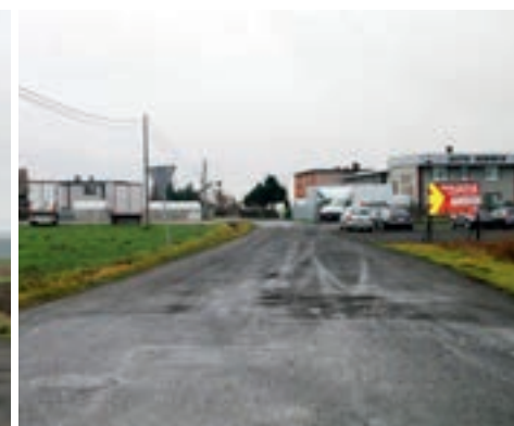
ul. Wierzbowa we Węgrach