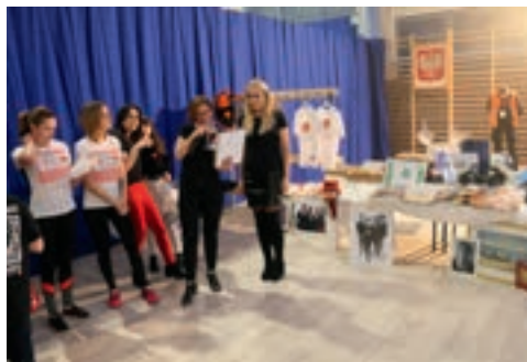
Dużo emocji dostarczyła licytacja fantów: