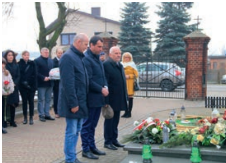
Złożenie wiązanek kwiatów na grobach AK-owców