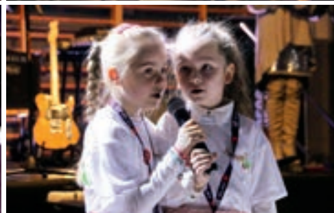
Atrakcją były występy dzieci i młodzieży