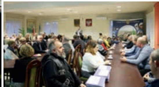
W tym roku wpłynęła rekordowa ilość 59 ofert konkursowych