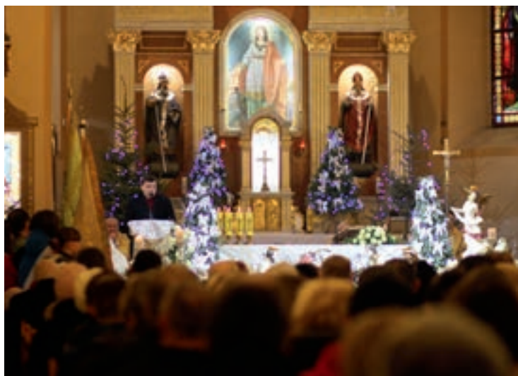
Msza św. w Sanktuarium Maryjnym w Skalmierzycach