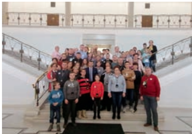
Uczestnicy wycieczki w Sejmie RP

Spacerem po Nowym Świecie i Krakowskim Przedmieściu dotarliśmy pod Kolumnę Zygmunta III Wazy i Zamek Królewski. Ostat-