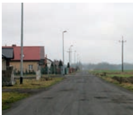
ul. Słoneczna w Fabianowie