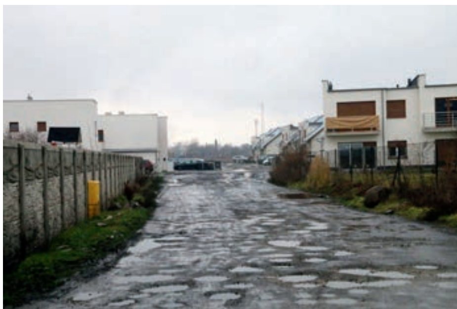
ul. Krótka w Nowych Skalmierzycach