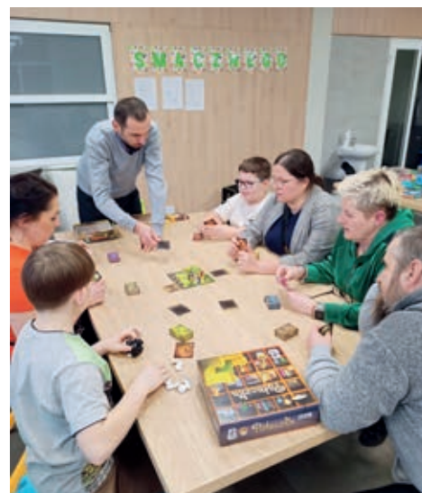
Z bogactwa zgromadzonych gier każdy mógł wybrać coś dla siebie i zagrać