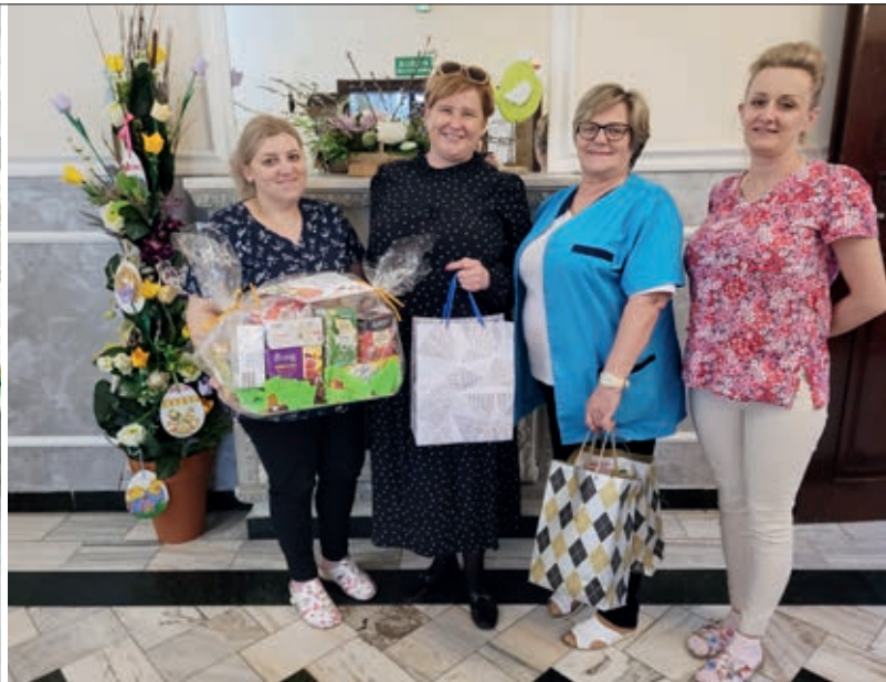
Dzieci i rodzice z przedszkola wspomogli zbiórkę herbat dla osób z Domu Pomocy Społecznej w Psarach