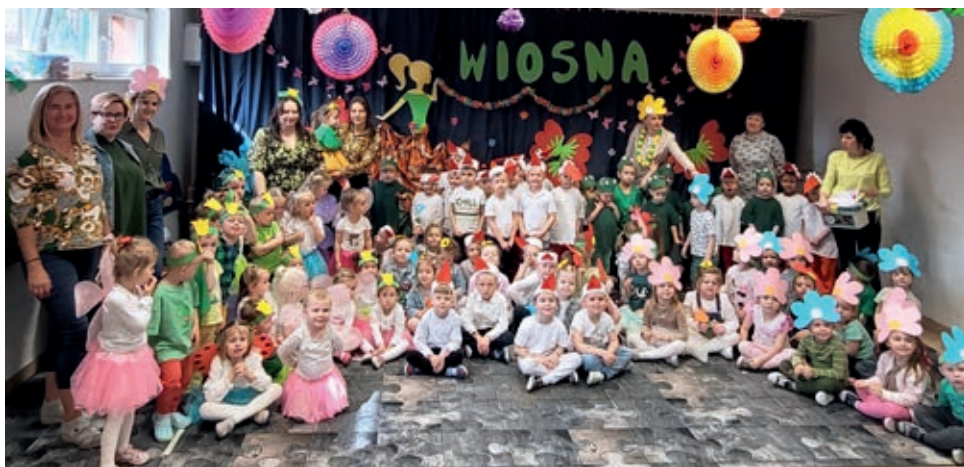
Przedszkolaki zaprezentowały wesoły wiosenny repertuar