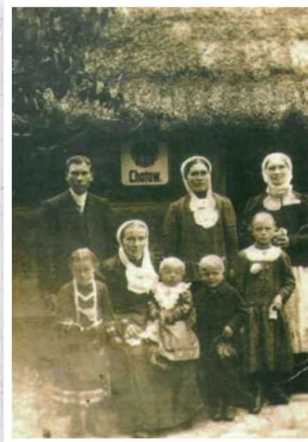
Mieszkańcy Chotowa w strojach ludowych ▲ ▼

Obecnie jednak te małe drewniane budowle zastąpiły nowoczesne wiejskie rezydencje, o jakich się niegdyś komornikom i budniarzom skalmierzycy nie śniło. Jeszcze teraz w centrum wsi spotkać możemy budynki powstałe przed I wojną światową, które stawiane były na miarę ówczesnych czasów i możliwości finansowych. Jedynie w skansenach wiejskich spotkać możemy kurne chaty czy też z okresu późniejszego jednoizbowe domy z sieni i komorą. Kurne chaty długo jeszcze można było spotkać we wschodniej Rzeczypospolitej. Charakteryzowały się one tym, że centrum domu stanowiło otwarte palenisko, z którego dym uciekał szparami w słomianym dachu.