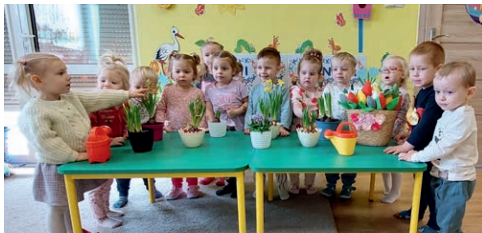
Dzięki takim inicjatywom dzieci uczą się szacunku do natury i rozwijają zainteresowania

Nie zabrakło muzykalnych atrakcji – dzieci tańczyły w rytm wiosennych piosenek, co nie tylko sprawiało im dużą radość, ale także rozwijało zmysł rytmu i koordynację ruchową.