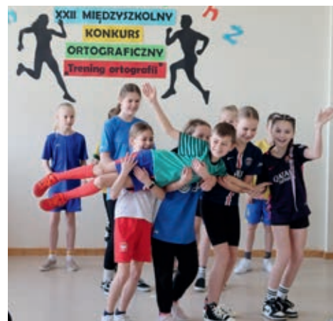
Tegorocznym rozgrywkom konkursowym towarzyszyło hasło „Trening ortografii”