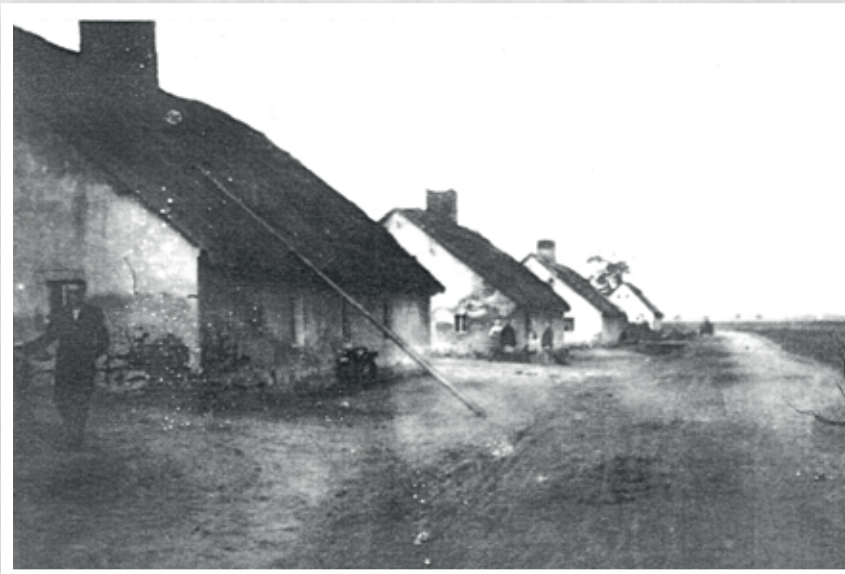
Budynki włościańskie z Mącznik

siadanego arealu miała więc zasadniczy wpływ na dochody i ewentualny rozwój gospodarstwa. Nie spotykamy tu wówczas gospodarstw kmiecyh, czyli jednołanowych o areale około 17 ha ziemi. Także domy i zabudowania gospodarcze były stawiane na miarę zasobności i dochodów z gospodarstwa, co można było dostrzec na przełomie XIX i XX wieku, kiedy szybko zaczęło rozwijać się tu rzemiosło. Zaowocowało to po-