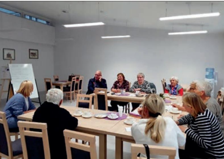
Zajęcia motywacyjne z psychologiem