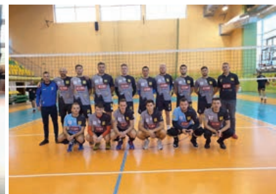
Legion na hali w Rzęśni