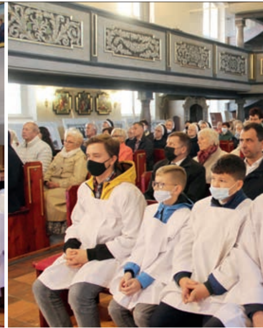
Msza święta w dniu inauguracyjnym wydarzenie