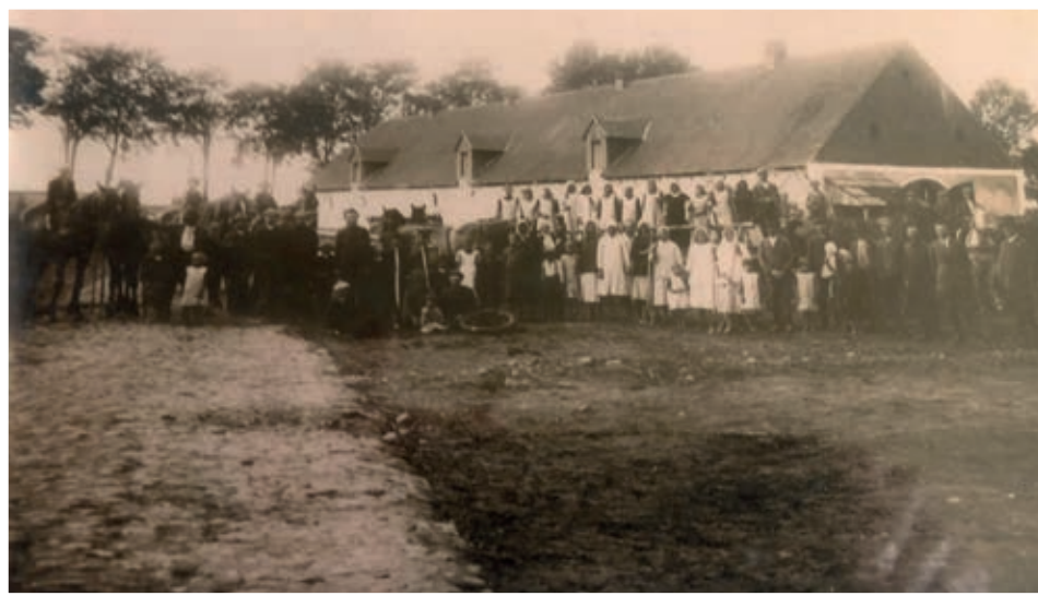
Pracownicy majątku Gałązki Wielkie

Istotnym elementem aktu recesji było unormowanie spraw własności i użytkowania wspólnych pastwisk, jakie dotychczas mieli włościanie dóbr Gałązek Małych leżących na terenie wsi Gałązki Wielkie. Kolejnym punktem recesu było zebranie w całość gruntów i wyznaczenie działek, jakie każdemu będą należeć. Zakończenie procesu uwłaszczenia było uzależnione od sporządzenia stosownych map, które wykonać miał uprawniony mierniczy. Ze względu na niezwykle długi okres sporzą-