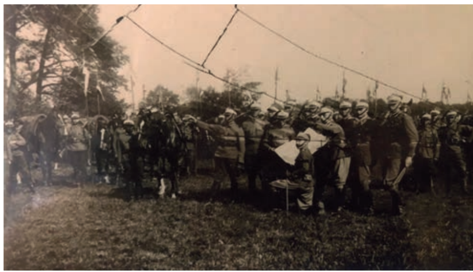
Manewry wojskowe w Gałązkach Wielkich