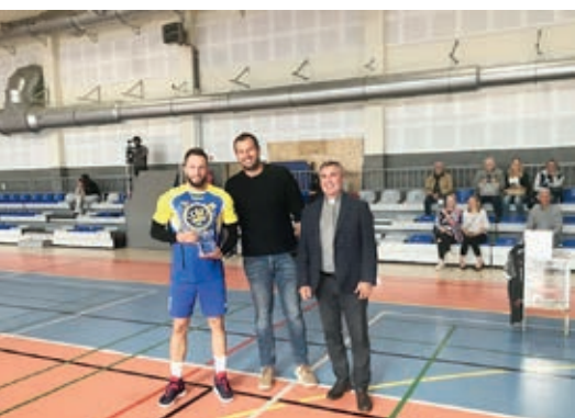
Kapitan Konspolu Słupca odbiera trofeum turnieju