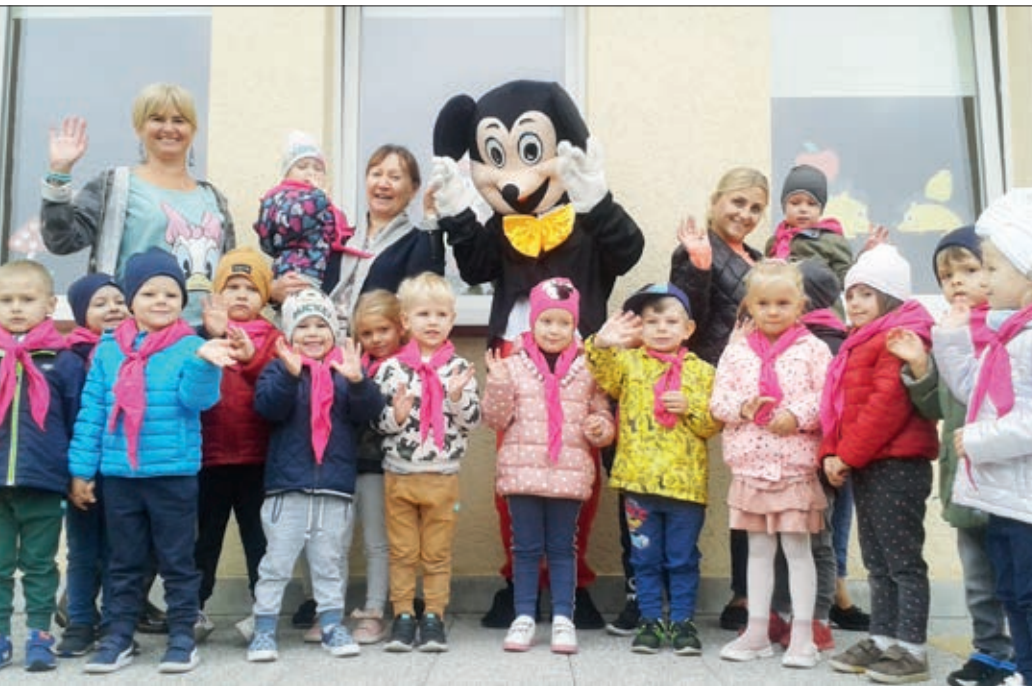
Taneczne zabawy z Myszka Miki