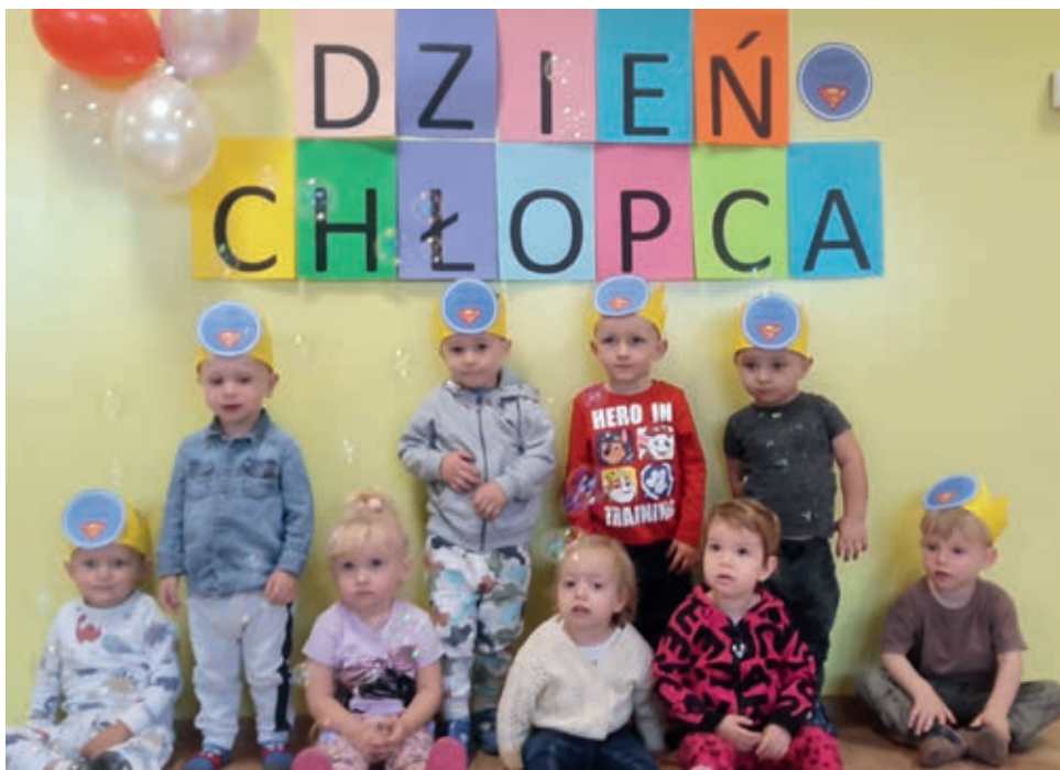
30 września w żłobku chłopcy obchodzili swoje święto

Od najmłodszych lat uczymy dzieci, aby pamiętały o ważnych uroczystościach w życiu rodziny czy życiu żłobka np. o Dniu Babci, Dniu Mamy, Dniu Taty. Równie ważne jest więc Święto Chłopców, które obchodzimy 30 września. W związku z tym świętem staramy się ich docenić jeszcze bardziej niż zwykle, obdarowując życzeniami i upominkami. Dzień był pełen atrakcji i wrażeń dla wszystkich dzieci, jednak to chłopcy czuli się bardzo wyróżnieni.