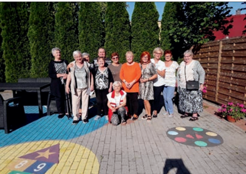
Spotkanie z psychoonkologiem