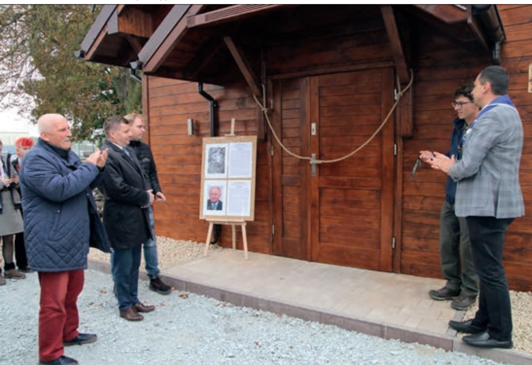
Otwarcie nowej, letniej harcówki im. hm. Kazimierza Tacika i phm. Kazimierza Gabisia

dobrym człowiekiem. To dzięki nim lokalne harcerstwo przetrwać mogło trudny czas PRL, ale też odrodziło się po jego rozpadzie.