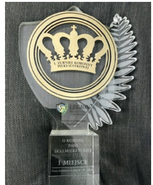
Trofeum Turnieju o Koronę Pani Skalmierzyckiej