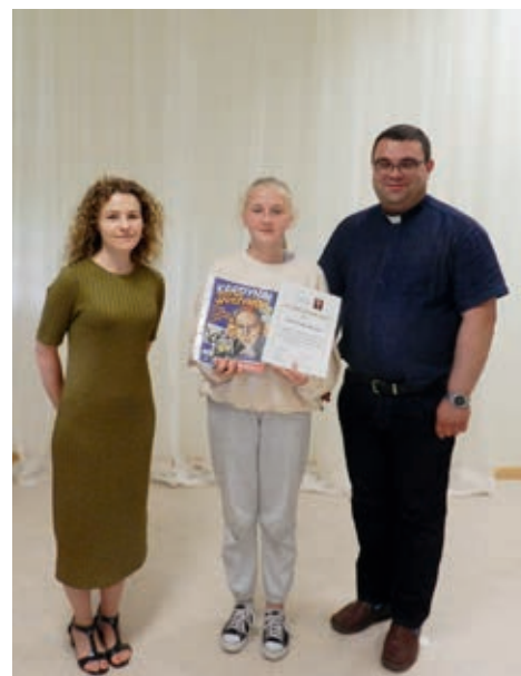
Laureatka konkursu literackiego

Konsekwencje Akcje szpiegowskie? Pomysłowość Obrońca praw? Miłość do osób, które cierpią Marzenie o ład w Polsce? Spełnione pragnienie Posada Prymasa? Dużo pracy, dużo chwil spędzonych z innymi Wykładowca? Rozdanie wiedzy i wiary Order Orła Białego? Za zasługi, które uczynił Kolegium Kardynałów? Doradca papieża Ostatnia Msza? Radość i smutek... A na końcu? Miłość