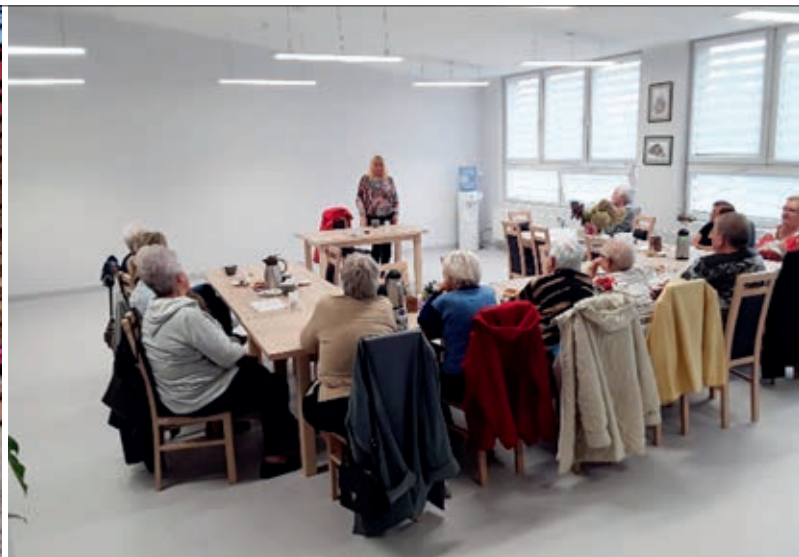
Spotkanie ze specjalistą dot. Metody Bowen'a