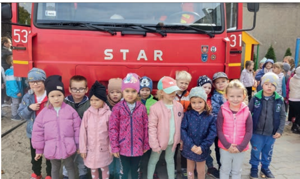
Na zakończenie akcji dzieci obejrzały pokaz umiejętności strażackich i pozowały do pamiątkowych zdjęć

W próbnej ewakuacji wzięły udział wszystkie dzieci z ośmiu grup przedszkolnych oraz cały personel placówki. Alarm oznajmiły trzy długie i głośne dzwonki. Mali wychowankowie pod opieką nauczycieli sprawnie i szybko opuścili budynek drogami ewakuacyjnymi i udali się w wyznaczone miejsce. Ćwiczeniom przyglądali się strażacy z OSP Skalmierzyce. Przeprowadzona ewakuacja została oceniona na piątkę z uśmiechem, a w nagrodę za dzielną postawę małe zuchy obejrzały pokaz umiejętności strażackich, zakończony pamiątkowym zdjęciem ze strażakami.