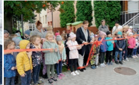
Uroczyste otwarcie nowej części placu zabaw