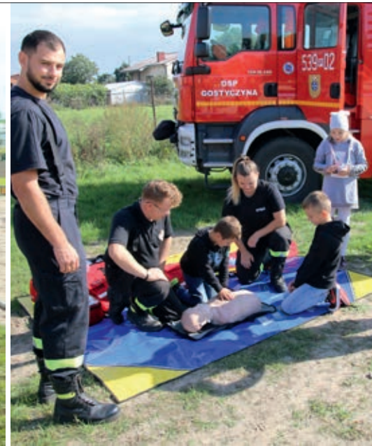
Otwarcie placu zabaw towarzyszył pokaz ratowniczy OSP Gostyczyna