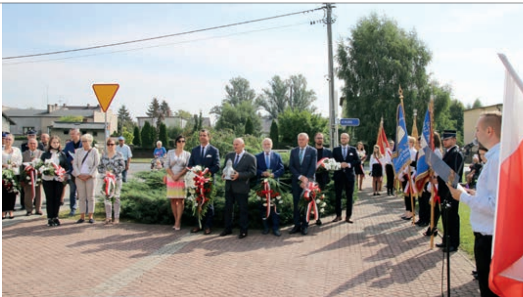
Jak co roku uczczono pamięć lotników składając wiązanki kwiatów i zapalając znicze