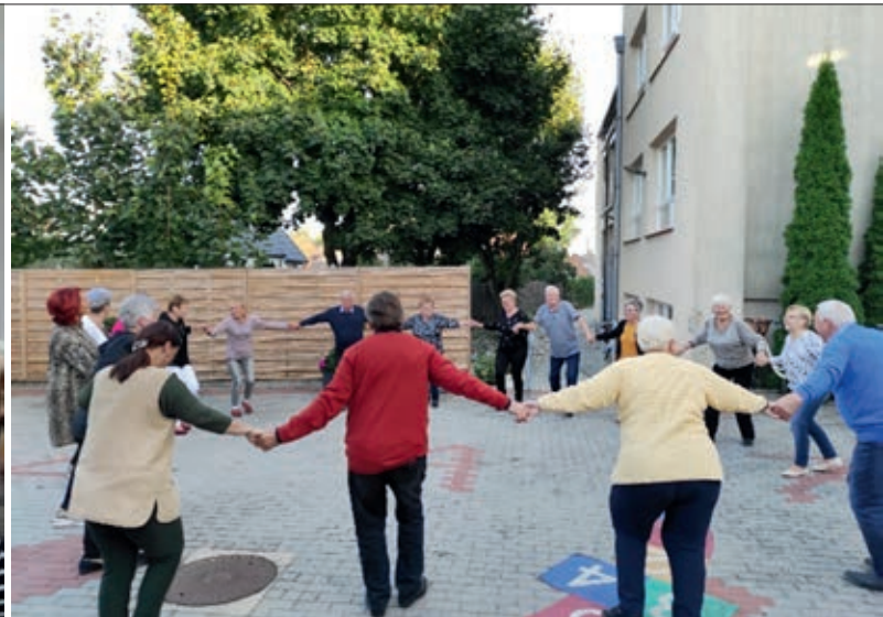
Biesiada pod chmurką