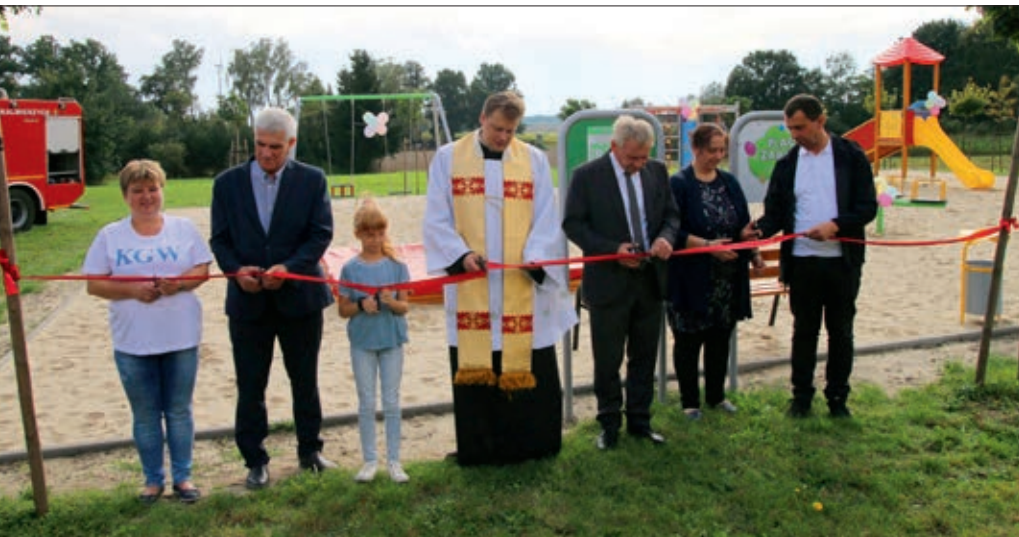
Otwarcie placu zabaw w Gostyczynie