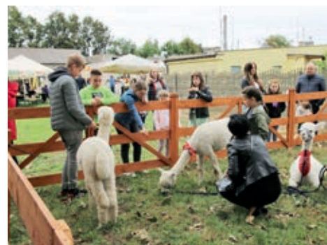
Na festynie nie zabrakło atrakcji dla najmłodszych