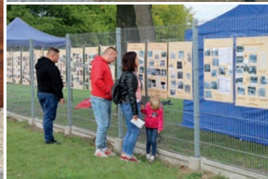
Wystawa o historii skalmierzyckiego harcerstwa